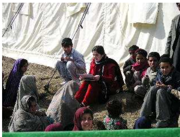
El programa empezó el 15 de noviembre y se está llevando a cabo en campamentos de Battagram/Besham, Gari Habibula, Balakot/Abbotabat e Islamabad.

En el momento de escribir este artículo — dos meses y medio después de comenzar el programa— los cuatro equipos se han dado cuenta de las reacciones psicológicas al trauma, han creado actividades sociales y han organizado voluntarios en cuatro campamentos grandes con tiendas. Cuando los voluntarios se sientan capaces y cómodos para llevar las actividades por su cuenta, los trabajadores de campo de la Sociedad de la Media Luna Roja de Paquistán comenzarán actividades similares en los pueblos y comunidades cercanas. El personal de la Sociedad de la Media Luna Roja de Paquistán supervisará, formará y dirigirá a estos voluntarios. Todas estas actividades se basan en evaluaciones participativas con los conocimientos que se han conseguido mediante entrevistas con un enfoque grupal y con muchas reuniones con las comunidades objetivo. Las sesiones de psicoeducación son una de estas actividades que se han llevado a cabo en diferentes grupos: niños de edades diferentes, mujeres y hombres. Las actividades sociales tienen el objetivo de crear un entorno seguro donde los distintos grupos puedan encontrarse, compartir problemas y preocupaciones y, al mismo tiempo, estar implicados de forma activa en las actividades que ellos mismos escojan.